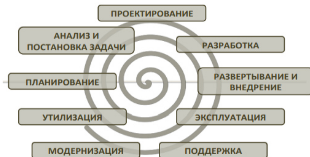
РИСУНОК 2. СПИРАЛЬНАЯ МОДЕЛЬ